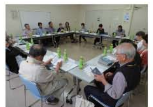
第1回理事会の様子