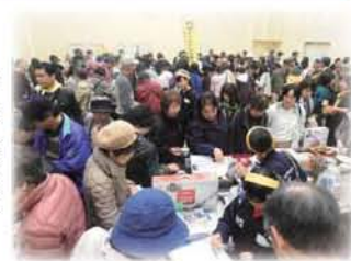
バザーはいつも人だかり