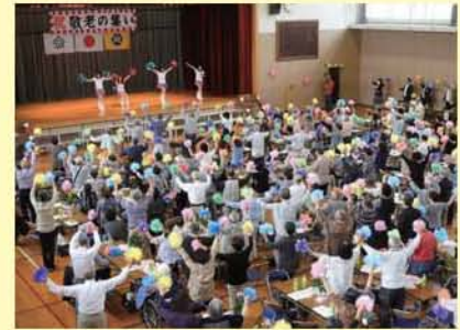
皆でポンポンを持って大盛り上がり