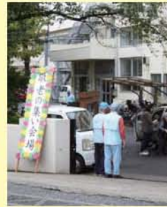
警備の様子(上座防犯)