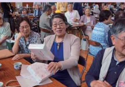
抽選会で当たったわ