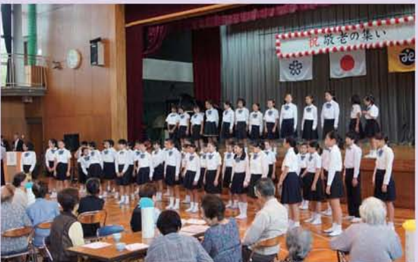
天使の歌声にうっとり