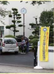
パトロールや消防団)