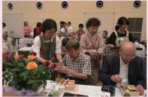
「抹茶を一服」どうぞ

※今年度は、88歳と90歳の招待者に敬老商品券をお渡ししました。 有効期限は平成31年1月31日(木)までです。 11月18日(日)のふくし祭りの他にスマイルサービスやいきいきサロンにも使用出来ます。