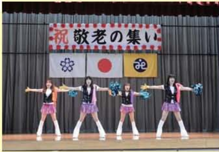
「ジュシーズ」の踊りとパフォーマンス