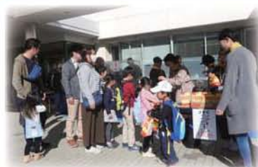
ポップコーンの行列

毎年大勢の皆様参加により、ふくし祭りを大盛況に開催出来ておりますこと、厚くお礼申し上げます。 今年も、地域の皆様のご支援を得て、 11月18日(日) 10時～14時、志津コミュニティセンターにて第26回ふくし祭り を開催します。 内容は、皆様にご好評の日用雑貨のバザー、お餅や焼きそば・豚汁・綿あめ・ポップコーン・農産物など販売の他、学校や福祉施設・商店会からも出店します。 そして、今年も小学生の絵画コンクールを予定しており子ども達の遊びの場としてキッズコーナーも設けます。 皆様にご満足いただけるふくし祭りになりたいと思っています。ご来場をお待ちしています。 ※雨天決行