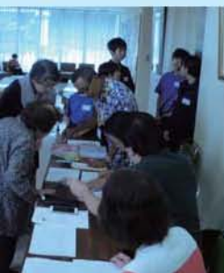
小学生がお出迎え