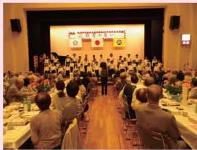
小竹小合唱部「四季の歌」