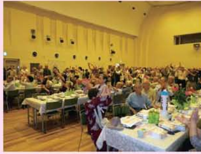
招待者168名元気に参加