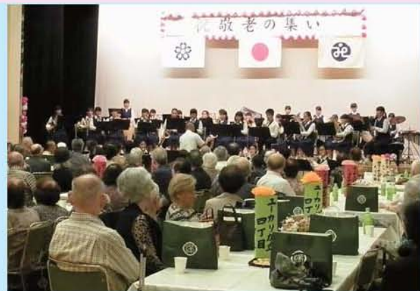
井野中学吹奏楽部の演奏