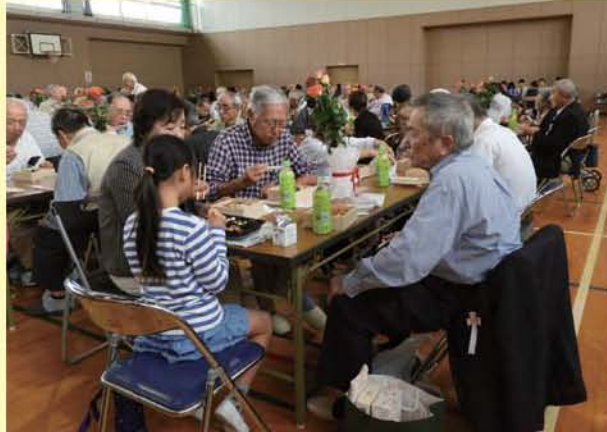
子ども達と一緒に昼食タイム