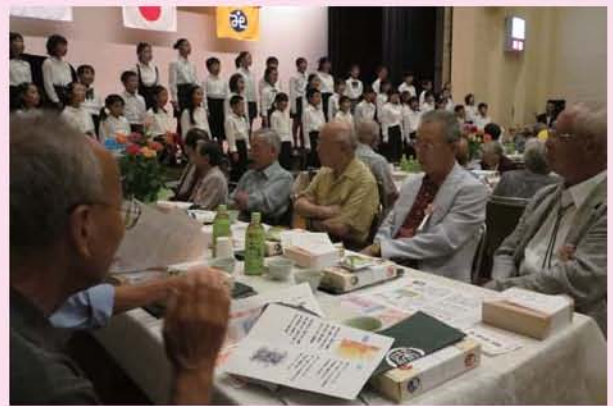
孫達?の合唱に「ウツリ」