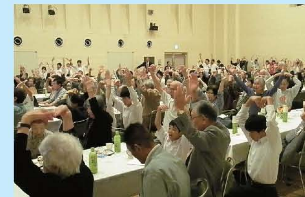
参加者全員で体操