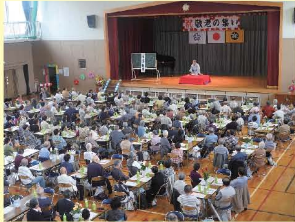
落語で笑いました