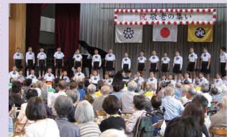
県代表 天使の歌声