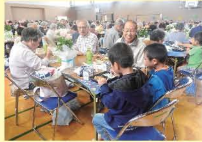
1年生と一緒に昼食