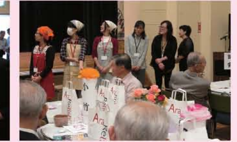
福引大会お手伝いPTA