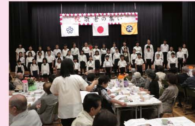
合唱部によるお祝い

※今年度も、敬老の集いご招待者全員に敬老商品券をお配りしました。有効期限は平成30年1月31日(水)までです。11月12日(日)のふくし祭りの他にスマイルサービスやいきいきサロンにも使用出来ます。