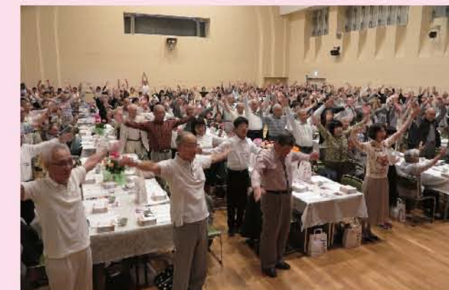
元気に「佐倉ふるさと体操」