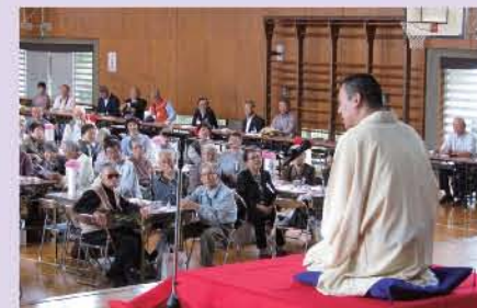
真打ならぬ二つ目登場