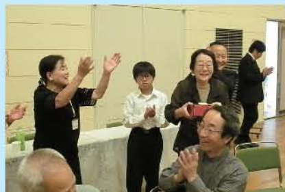
ジャンケン優勝者