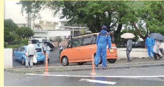
警備の様子(上座防犯パトロールや消防団)