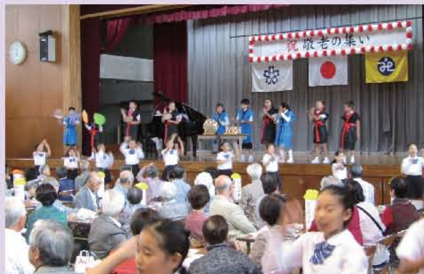
仮装と踊りも交えて