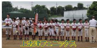
上志津フェニックス

大会が無事に終わることができたのも、除で支えていただいている役員や保護者の皆様のおかげと感謝申し上げます。