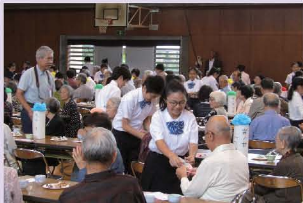
児童から手作りのプレゼント