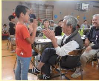
3年生と楽しく手遊びを