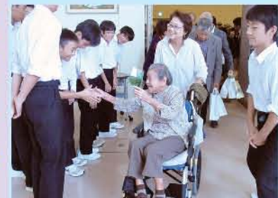
最高齢の方をお見送り