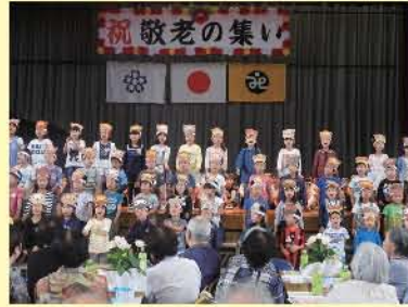
1年生によるかわいい合唱