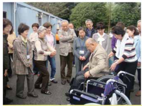
ユーカリが丘地区社協

高齢者・子育て中のお母さん・障がいを持つ方が、住み慣れた地域で、快適で充実した生活が送れるようにしようと、数年前より研究を始めました。 平成23年、具体的にサポートシステム検討会を立ち上げ、先進地域の視察、センターの設置場所等の選定をし、平成24年7月1日開室式を迎えました。翌2日ふれ愛喫茶を開業、10月1日ふれ愛サービス開始となりました。当初心配していた支援希望も10月中旬に50件を越し順調に事業が進んでいます。改善すべき点多々ありますが頑張ります。