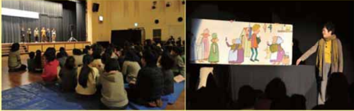
昨年のお話フェスティバルの様子